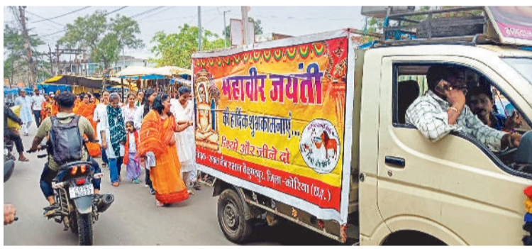
हरिभूमि न्यूज. बैकुण्ठपुर

महावीर जयंती के अवसर पर मंगलवार को सकल जैन समाज बैकुण्ठपुर के तत्वाधान में स्वामी महावीर की शोभायात्रा वाहन में सजाकर बाजारपरा से शहर क्षेत्र में