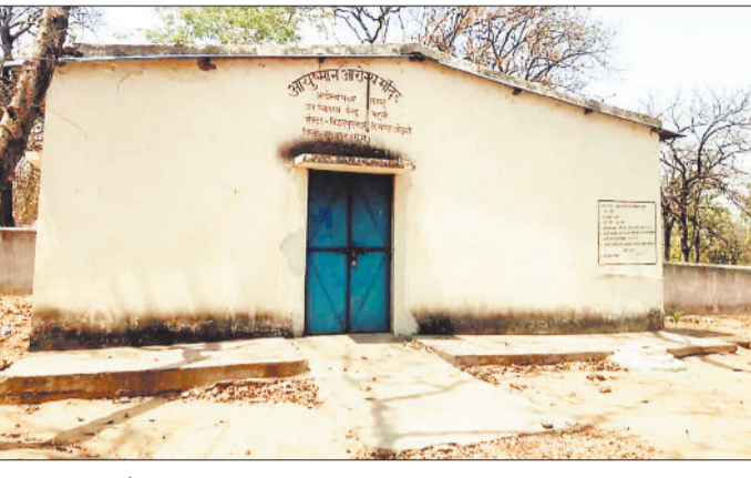
बंद उप स्वास्थ्य केंद्र।

स्वास्थ्य कर्मियों के अभाव में पिछले एक सप्ताह से उप स्वास्थ्य केंद्र महली में ताला लटका है तथा दूरस्थ चांदनी-बिहारपुर क्षेत्र में स्वास्थ्य सुविधाएं पूरी तरह से ठप हो गई हैं। हर दिन दूरस्थ क्षेत्रों से पीड़ित पैदल लम्बा सफर कर स्वास्थ्य केंद्र पहुंच रहे हैं तथा ताला लटका देख