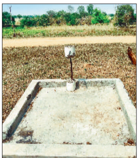
खस्ताहाल रट्टेड पोस्ट।