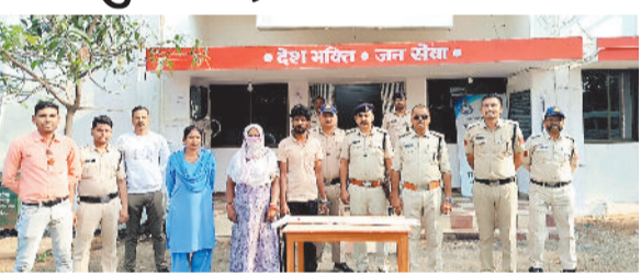
हरिभूमि न्यूज. अनुपपुर