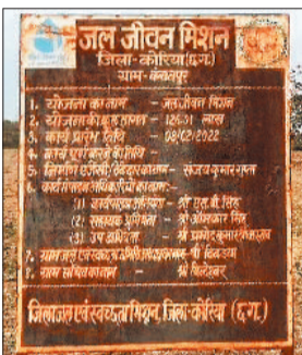
निर्माण कार्य का लगा बोर्ड।