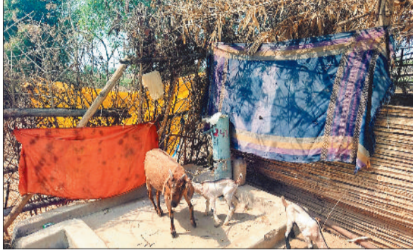
पाइप लाइन में बांधी गई बरकी।

विभिन्न कारणों से जिले के पंचायत क्षेत्रों में जल जीवन मिशन का कार्य पूरा नहीं हो पाया, इसके चलते जिले के कई पंचायत क्षेत्रों में करोड़ों खर्च के बाद भी ग्रामीण परिवारों को इस गर्मी में पेयजल के लिए परेशान होना पड़ रहा है। खासकर गर्मी के शुरूआत होने के साथ ही जिले के कई ग्रामीण क्षेत्रों में पेयजल संकट गहराने लगता है। ज्यादातर गांव में हैंडपंप पेयजल प्राप्त करने के प्रमुख माध्यम है, लेकिन गर्मी के शुरूआत होने के साथ ही कई क्षेत्रों में जल स्तर घटने के कारण हैंडपंप भी किसी काम के नहीं रह जाते। मिली जानकारी के अनुसार जिले के कई